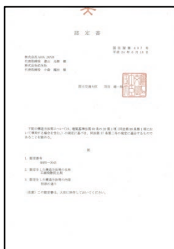
国土交通省認定書